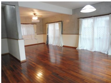
目の前は公園なので明るい